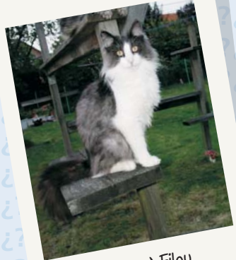
Le Grand Filou

Sehr geehrte Damen u. Herren, lasst euch von Stiftung Warentest nicht ins Bockshorn jagen - das habt Ihr ja Gott sei Dank nicht nötig.