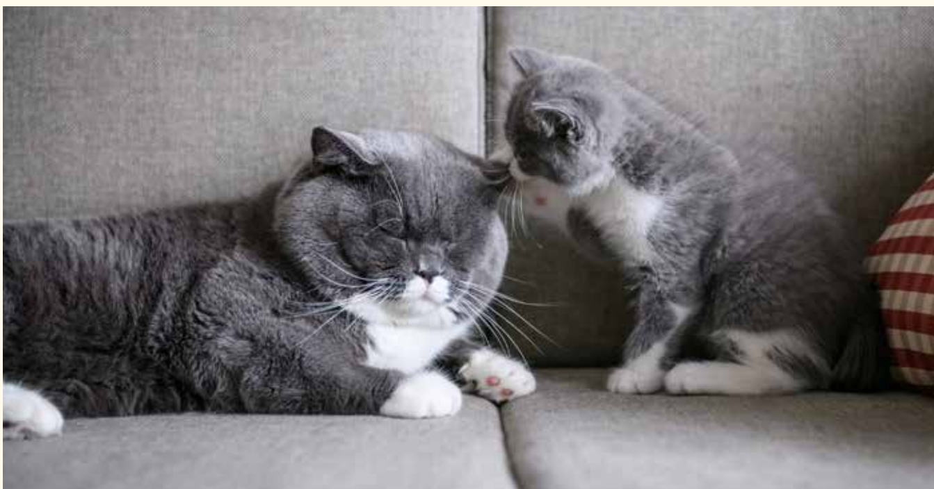
Foto: © Chendongshan · shutterstock.com · Fotos: Leckerchen (2): © Oliver Götz Fotografie

Als Faustregel gilt: Je älter, desto schwieriger ist meist die Zusammenführung. Frei nach dem Motto: „Gleich und gleich gesellt sich gern“ hilft es, wenn die Katzen sich in Alter, Geschlecht, Wesen, optischen Merkmalen/Rasse etc. so ähnlich wie möglich sind. Eine Garantie gibt es jedoch nicht. Es ist außerdem von Vorteil, wenn man die zu vergesellschaftenden Katzen bereits gut kennt oder ihr Wesen anhand ihrer Herkunft zumindest einigermaßen beurteilen kann.