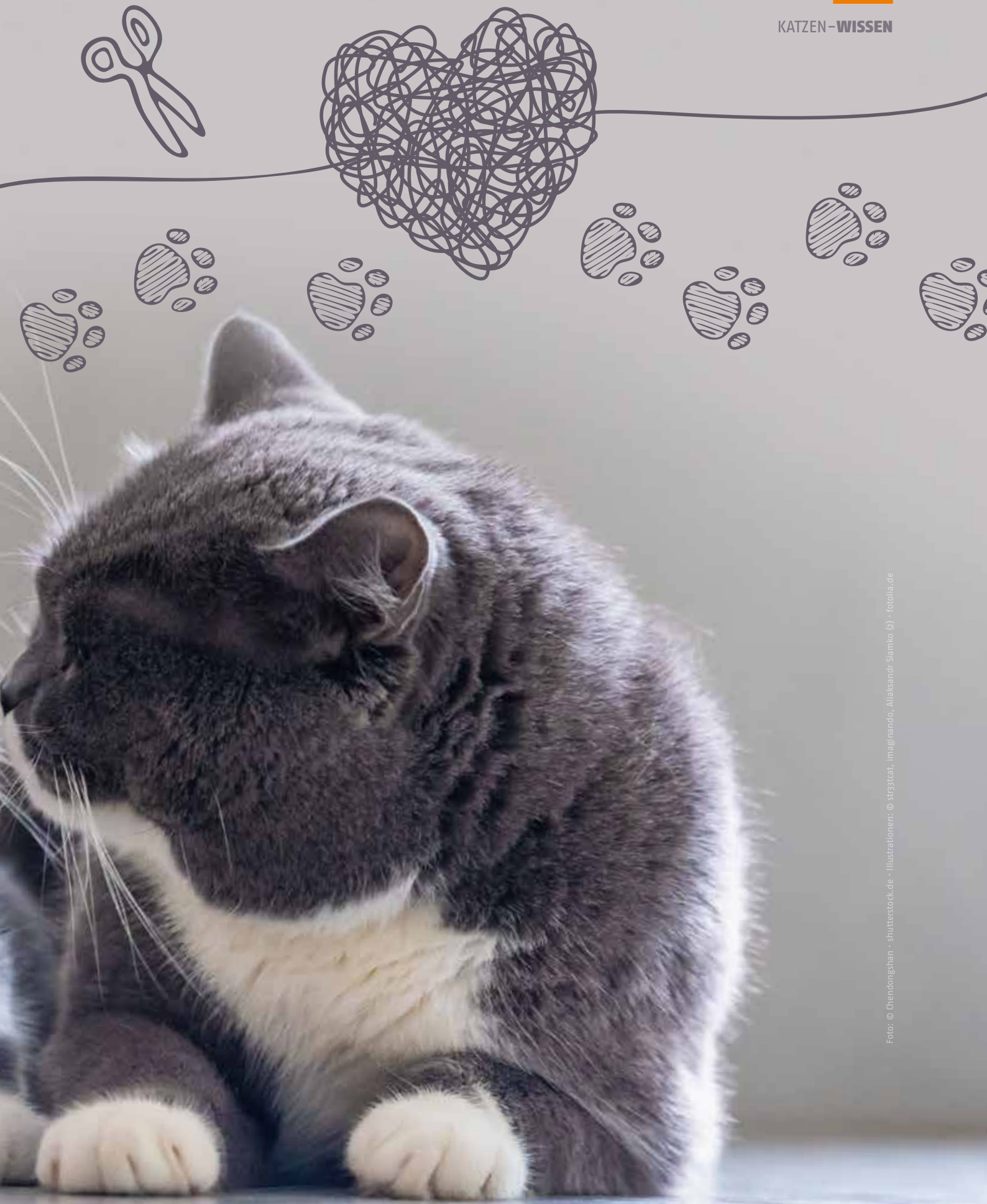
Foto: © Chendongshun - shutterstock.de · Illustrationen: © str33tcat, imagi'nando, Aliaksandr, Siamko (2) - fotolia.de